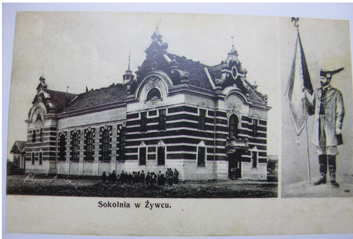
1.Karta okolicznościowa z ok. 1906r.