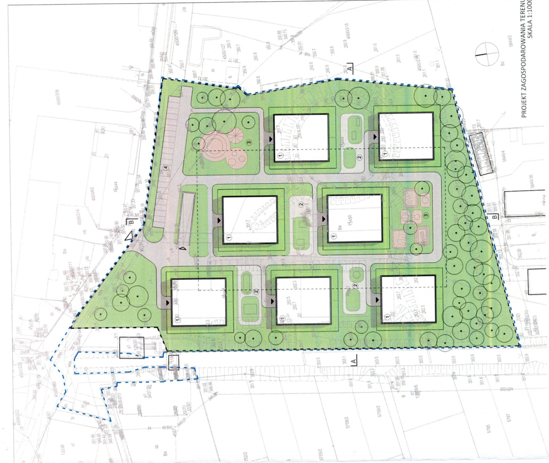
PROJEKT ZAGOSPODAROWANIA TERENU SKALA 1:1000